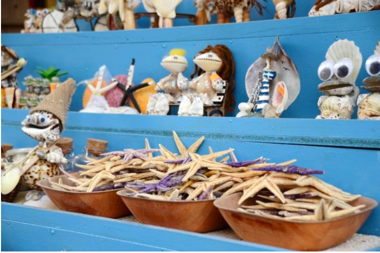
Görsel 8. Safranbolu’da satılan hediyelik eşya (deniz kabuğu biblolar ve deniz yıldızları)