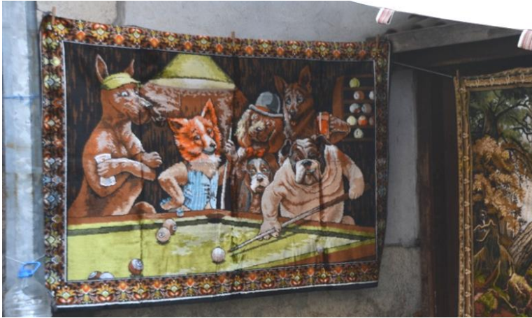
Görsel 7. Safranbolu'da satılan hediyelik eşya (duvar halısı)

Sahadaki örneklerden, hediyelik eşyaların satışında ticari kaygıların ön planda tutulduğu, kültürel mirasın, geleneksel niteliklerin ve turist taleplerinin ise göz ardı edildiği gözlenmektedir (Görsel 7 ve Görsel 8).