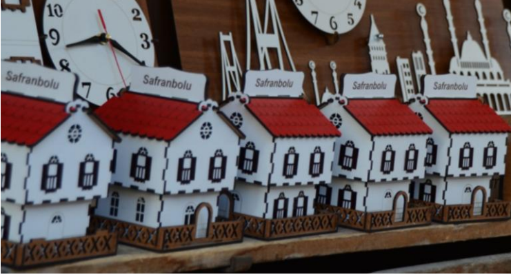
Görsel 5. Safranbolu’da satılan hediyeelik eşya (ev)