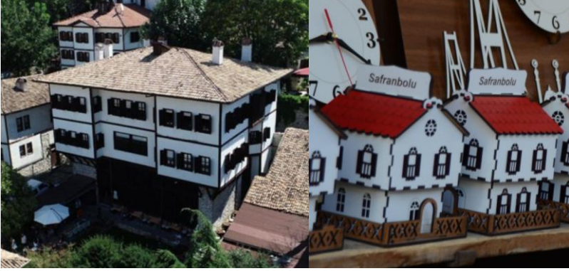
Görsel 6. Gerçek Safranbolu evi ile satılan hediyelik eşya (ev) karşılaştırması

Sahadaki örneklerden, hediyelik eşyaların satışında ticari kaygıların ön planda tutulduğu, kültürel mirasın, geleneksel niteliklerin ve turist taleplerinin ise göz ardı edildiği gözlenmektedir (Görsel 7 ve Görsel 8).