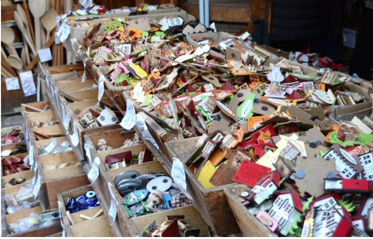
Görsel 9. Yöresel özelliklere sahip hediyelik eşyalar sunumundaki farklı yaklaşımlar