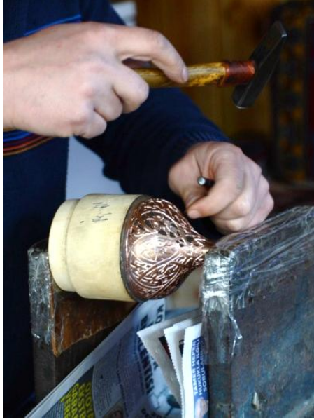
Görsel 11. Geleneksel yöntemlerle üretilen hediyelik eşyalar