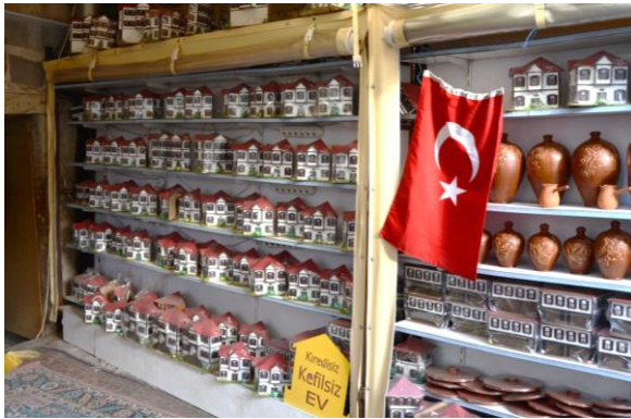
Görsel 4. Hediyelik eşya (Safranbolu evleri)

Safranbolu’nun sahip olduğu kültürel miras ve değerlerin günümüzde üretilen ve satışı yapılan hediyelik eşyalara yansımadağı görülmektedir. Şöyle ki, Tarihi Çarşı olarak adlandırılan ve turistlerin ziyaret bölgede satışı yapılan pek çok hediyelik eşyanın, yöreye özgü niteliklerden uzak olan tek tip ürünlerden oluştuğı gözlenmiştir (Görsel 4 ve 5).