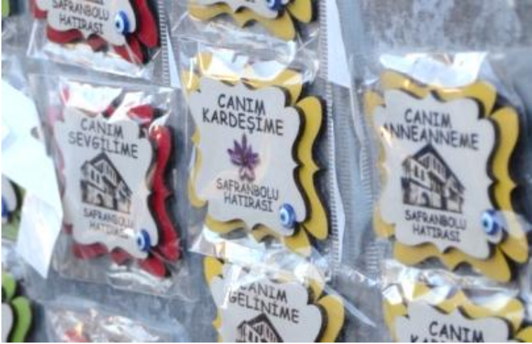
Görsel 10. Hediyelik eşya sunumundaki farklı yaklaşımlar